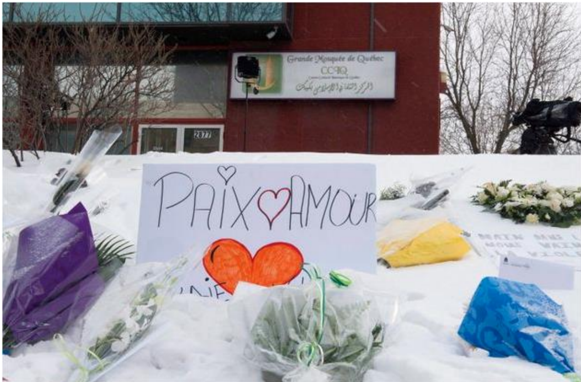
THE CANADIAN PRESS/JACQUES BOISSINOT

Des pancartes installées devant la Grande mosquée de Québec, le mercredi 1er février 2017 à Québec (photo d'archives)