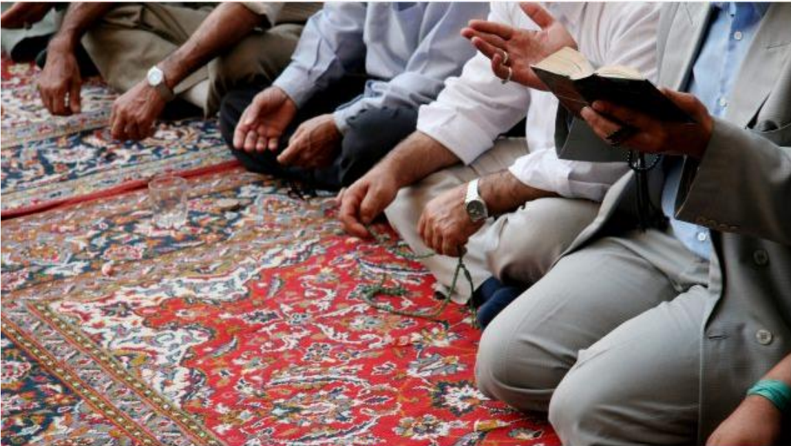
Des musulmans lors d'une séance de prière.