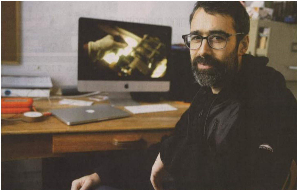
Academy Award-nominated filmmaker Ariel Nasr's film The Mosque: A Community's Struggle will have its theatrical premiere next week in Montreal during Muslim Awareness Week. ALLEN McINNIS